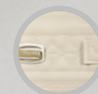
Morbida fascia perimetrale in microfibra ricamata con maniglie e aeratori