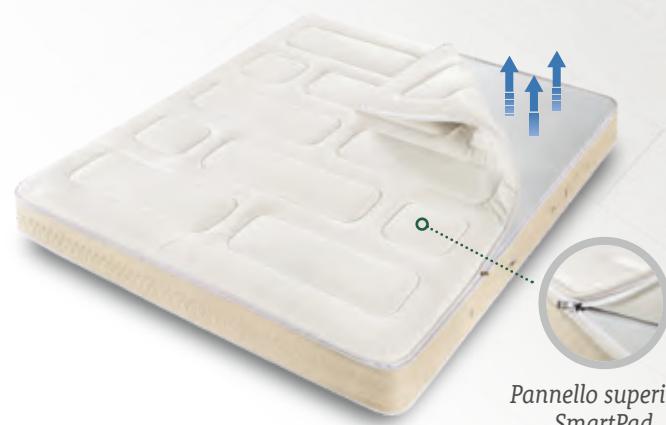
Pannello superiore SmartPad rimovibile e reversibile