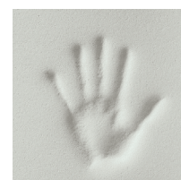
MEMORY FOAM 3 cm